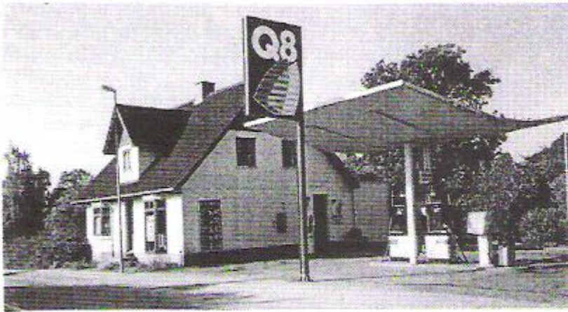
Hørretvej 17 - 15. november 1995

man søger om del i puljen, må man selv betale udgifterne. Og det kan i givet fald blive en bekostelig affære – langt over 100.000 kroner.