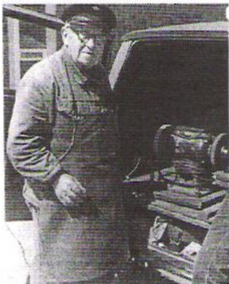
A.P. som skærsliber

Skærsliberen, der havde tjent ham trofast under hele krigen, blev afløst af den lille DKW med plads til elektrisk slibesten med 2800 omdrejninger i minuttet samt andet grej. Strøm lånte han hvor han kom frem. "Go`daw og Gud fri vos, her er jeg igen", var hans hilsen, hvor han kom frem til dem, han kendte. Skævede folk til ham, når han kom første gang, sagde han: "Smil lidt til mig, så er I meget kønnere!"