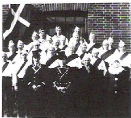
Fastelavn i Hørret 1930