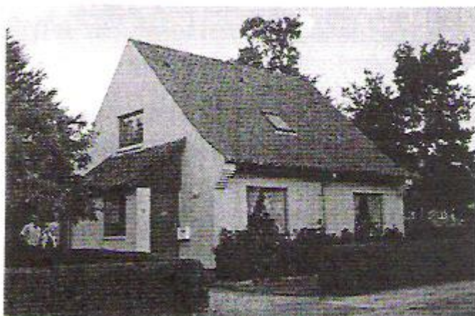
Det lille gule hus.